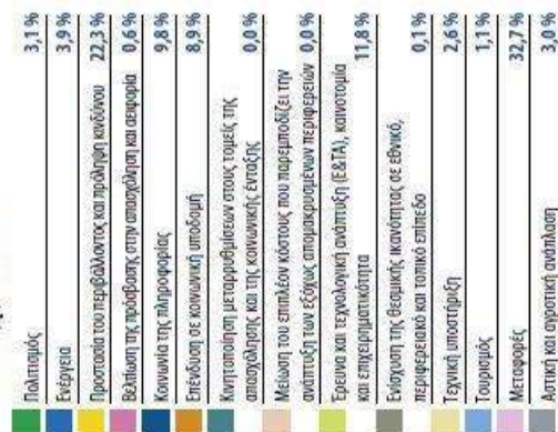
Ευρωπαϊκό Κοινωνικό Ταμείο 2007-2013